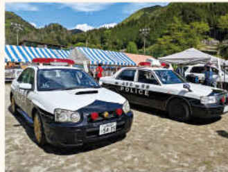
パトカー&白バイ展示