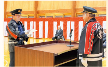
新入団者からの宣誓