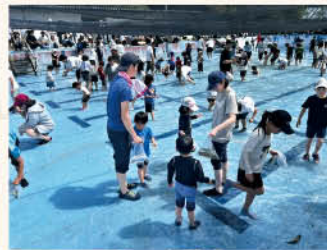
マスのつかみ取り