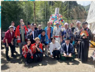
三ヶ村箭弓神社氏子中

多くの来場者の皆さまをお迎えできましたことを改めてお礼申し上げます。本当にありがとうございました。